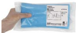
Kit d'entraînement ScalpelCric non stérile