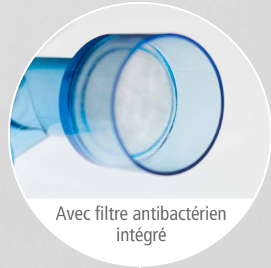
Avec filtre antibactérien intégré